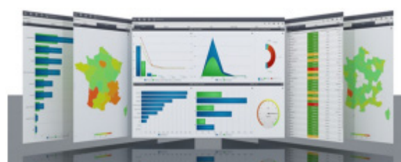
Indicateurs de gestion Gfi-MyMetriks

Toutes ces actions de modernisation et d'amélioration de la performance du secteur public engendrent une succession de problématiques budgétaires, comptables et financières mais également technologiques.